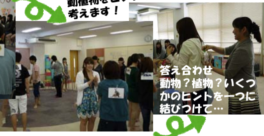
答え合わせ 動物?植物?いくつかのヒントを一つに結びつけて...