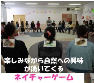
楽しみながら自然への興味が湧いてくる ネイチャーゲーム

この授業では、子どもの発達を「環境」の視点から捉え、幼児教育の基本である「環境を通して行う教育」とはどのようなことなのかを理解し、幼児が主体的に環境とかかわり、様々な力が育つ望ましい保育環境の在り方について学びます。この日は身近な動植物と子どものかかわりについての演習授業でした。