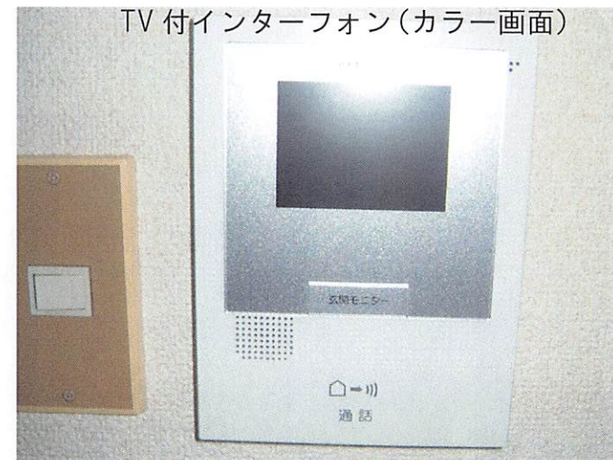
TV付インターフォン(カラー画面)