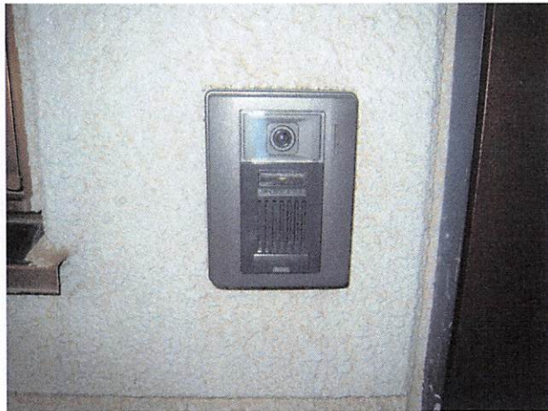
TV 付インターフォン(カラー画面)