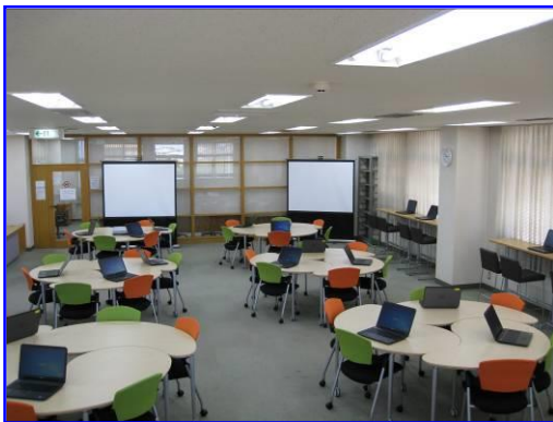
図書館（ラーニング・コモンズ）