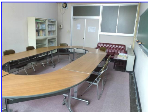
教職サポートルーム